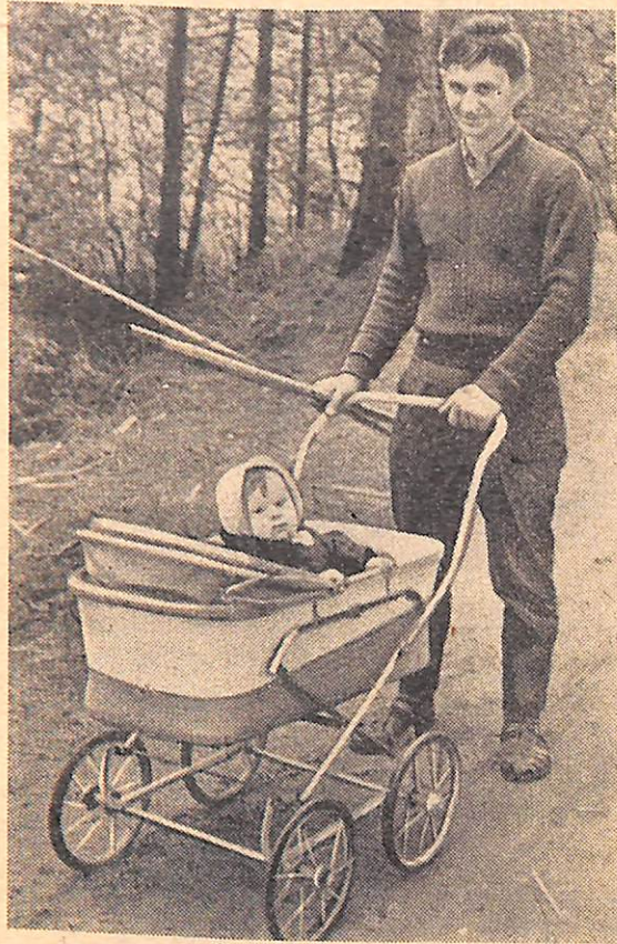
С папой на рыбалку.

Наш фотокорреспондент Ю. Кондратьев недавно принес в редакцию снимки одного воскресного дня. Сегодня мы предлагаем их вашему вниманию.