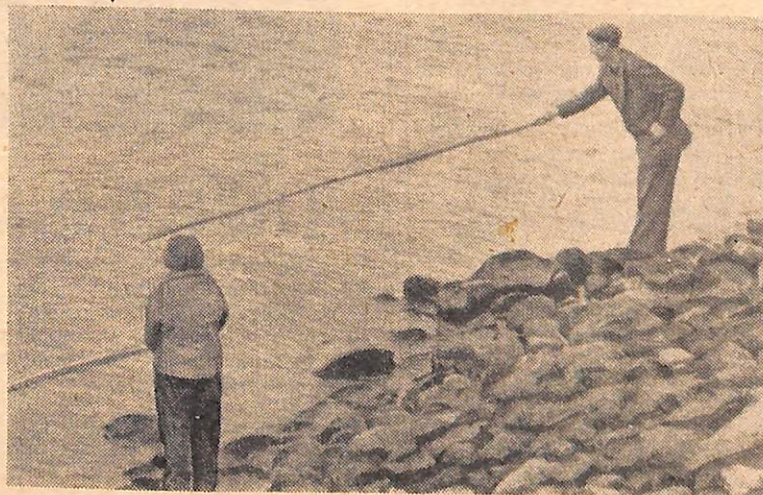
За рыбацким счастьем.

Вместо строк «...цех № 9 не выполнил план...» следует читать «...цех № 19 не выполнил задание по выпуску товарной продукции».